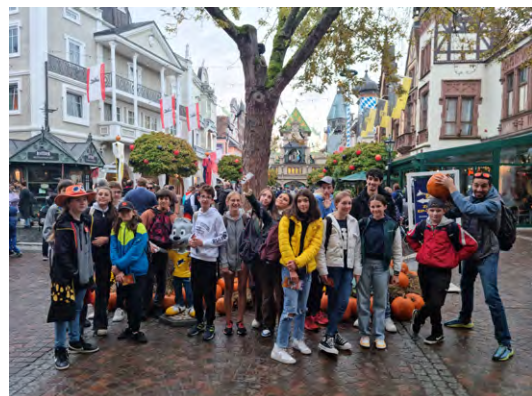
>> Séjour Europa Park 2022