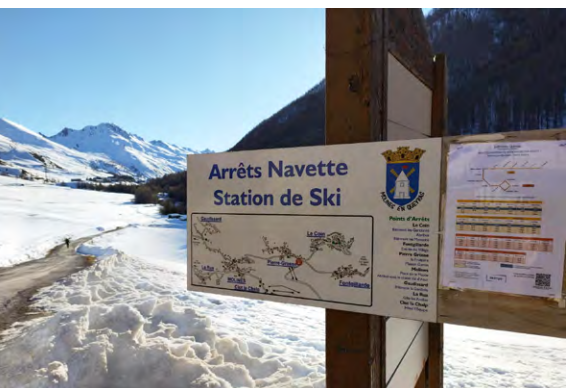
» Arrêt navette Molines

Retrouvez toutes les infos sur www.ccguillestroisqueyras.fr/vivre/deplacements