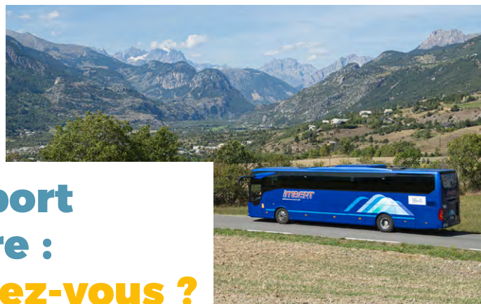
» Transport scolaire

https://zou.maregionsud.fr/se-deplacer-en-bus/se-deplacer-en-bus-dans-les-hautes-alpes/