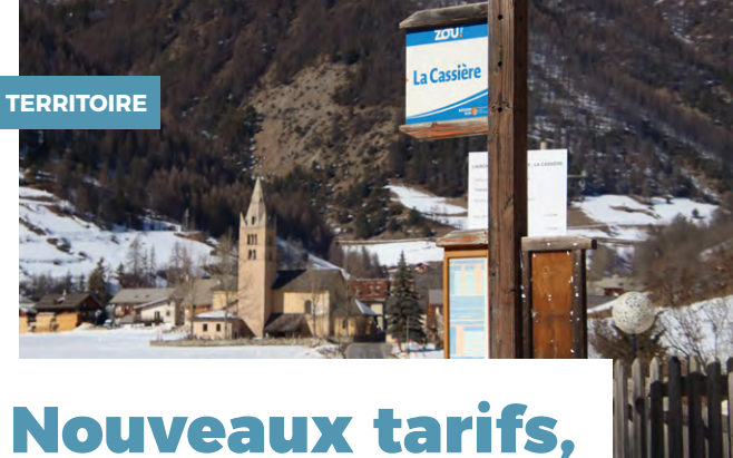
» Arrêt navette Arvieux