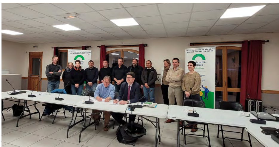
>> Signature de la CTG