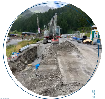
» Travaux Vars Les Claux

› Rénovation des réseaux humides à Pierre Grosse à Molines avant réfection de l'enrobé par le Département réalisée par Bucci Frères .