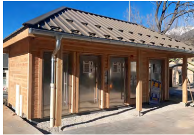
>> Sanitaires de la ZAE du Villard

La requalification de la Zone d'Activité Economique (ZAE) du Villard a nécessité des travaux de création, de réaménagement et de rénovation des équipements publics présents sur la zone pour ses clients et pour les entreprises susceptibles de s'y implanter.