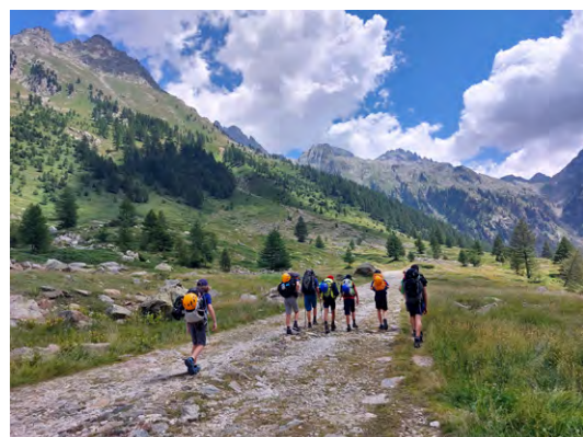
>> Camp montagne 2022