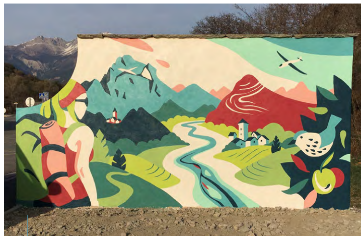
>> Fresque à Saint-Clément-sur-Durance