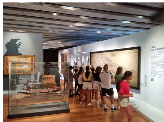
>> Camp culturel Marseille 2022