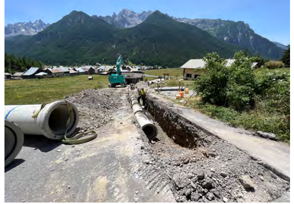
» Travaux Ceillac