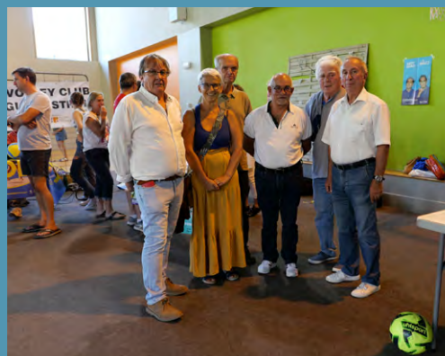
>> Forum des associations 2022

L'occasion pour les habitants du Guillestrois-Queyras de prendre connaissance des activités proposées sur le territoire pour les petits et les grands.