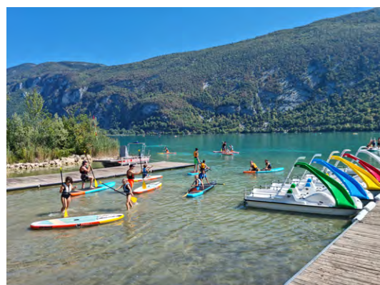
>> Camp sportif Paladru 2022