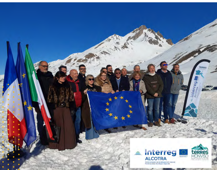
Délégation représentée lors de la signature

Cette coopération permettra aussi d'accompagner la mise en place de projets futurs européens Alcotra France - Italie.