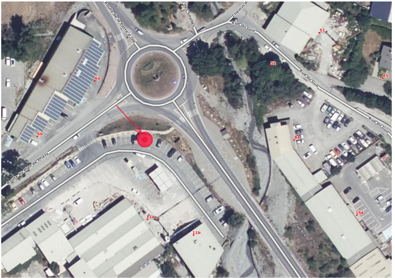
Emplacement actuel vu depuis la RD 902 A :